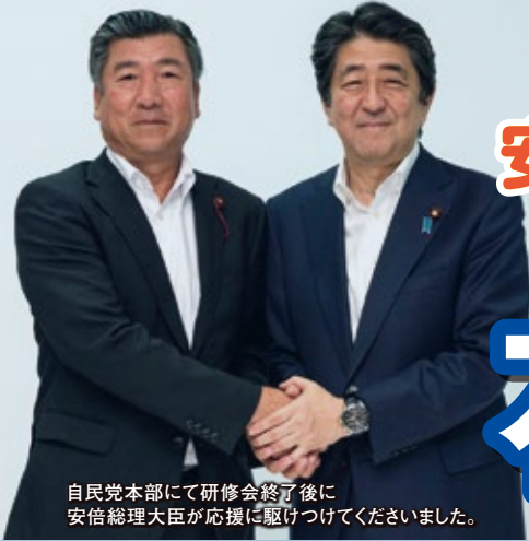
自民党本部にて研修会終了後に安倍総理大臣が応援に駆けつけてくださいました。