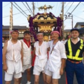
検見川神社祭礼にて11年連続で消防団の仲間と共にお神輿を担っている様子。