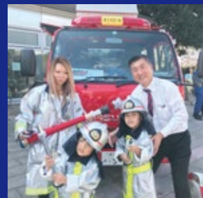
花見川区民まつりにて消防団へのお手伝い中。