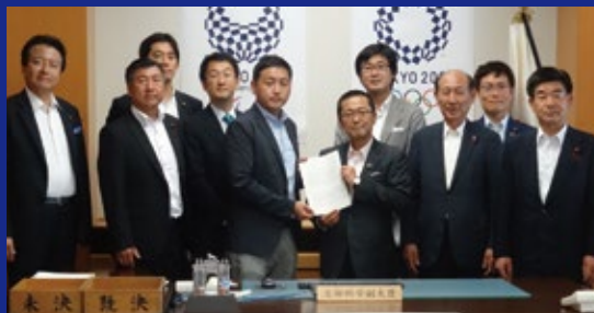
オリパラ競技開催地として取り組みの強化を推進して行きます。